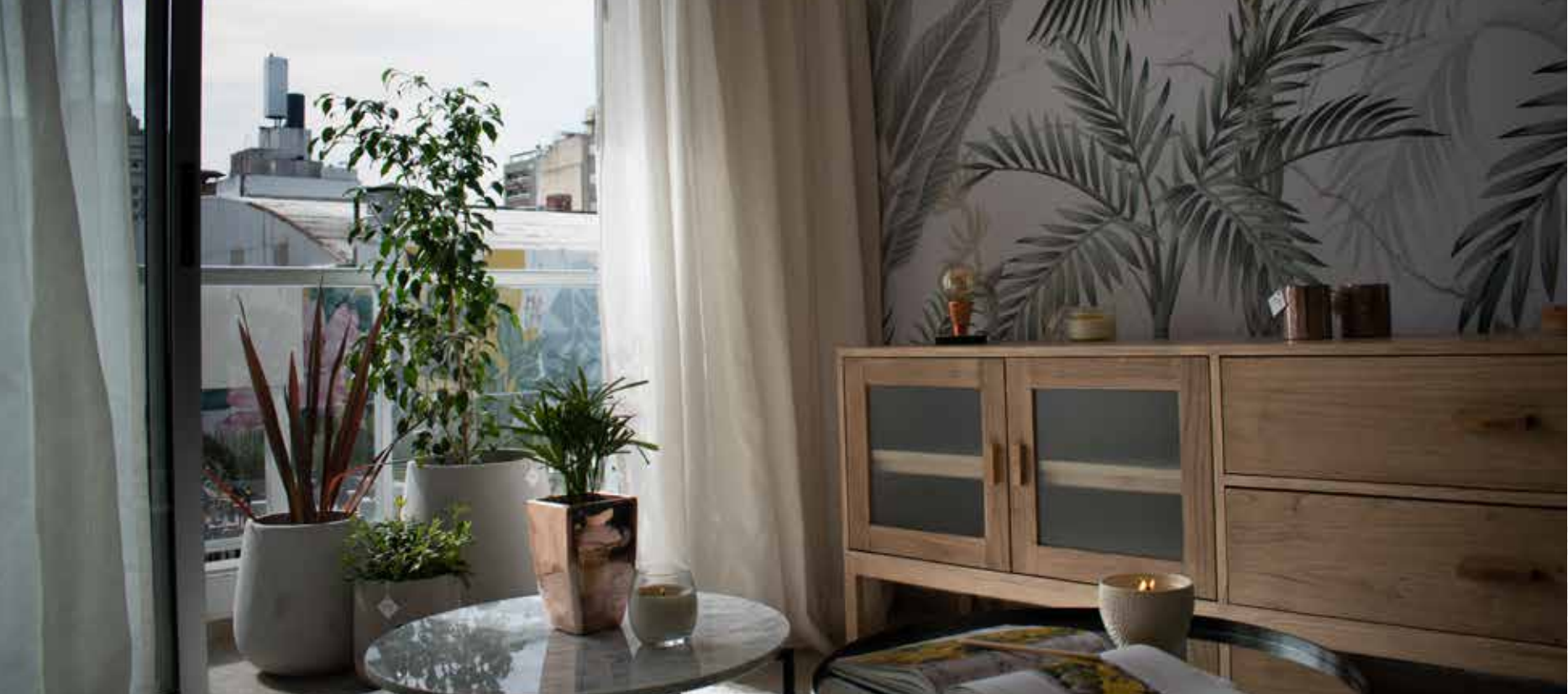
AMBIENTACIÓN IDEAR MAV HOME