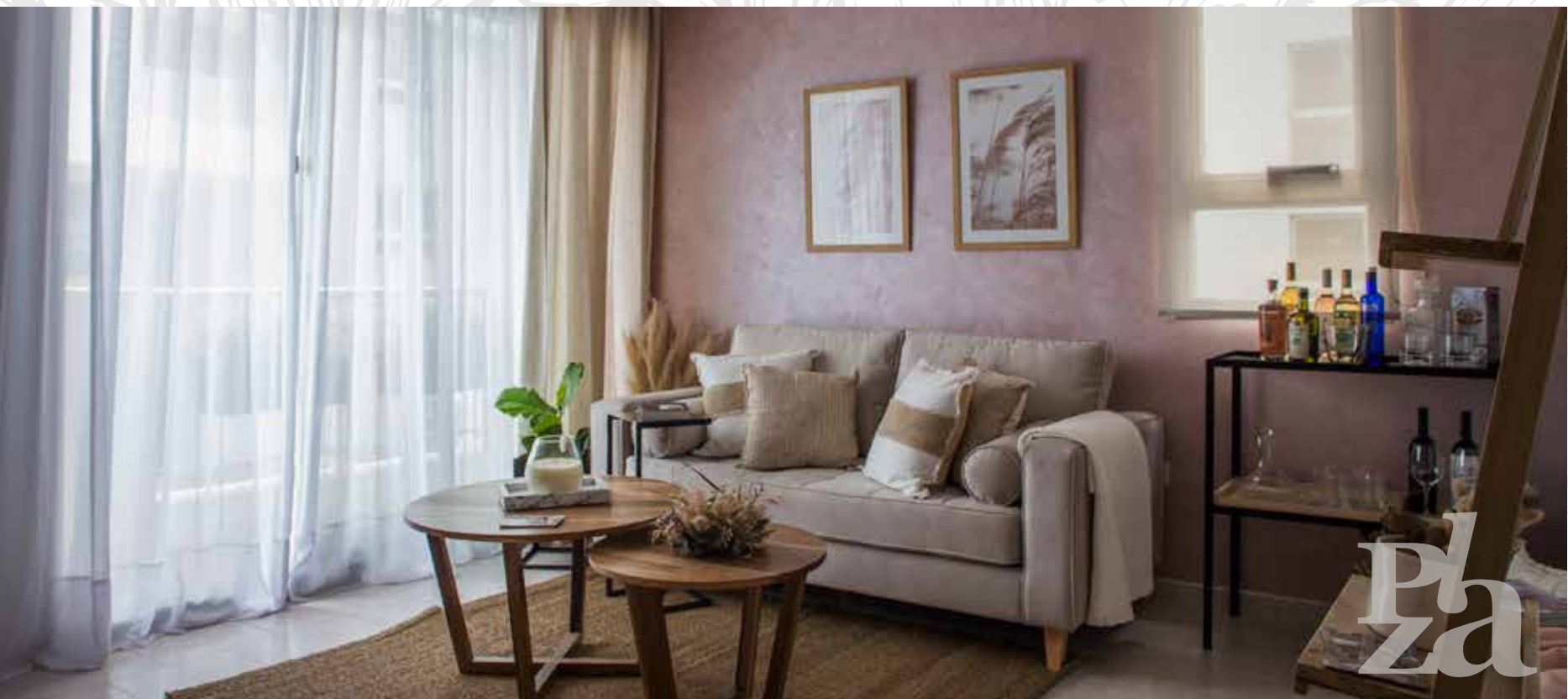
AMBIENTACIÓN SENTIR LA CASA